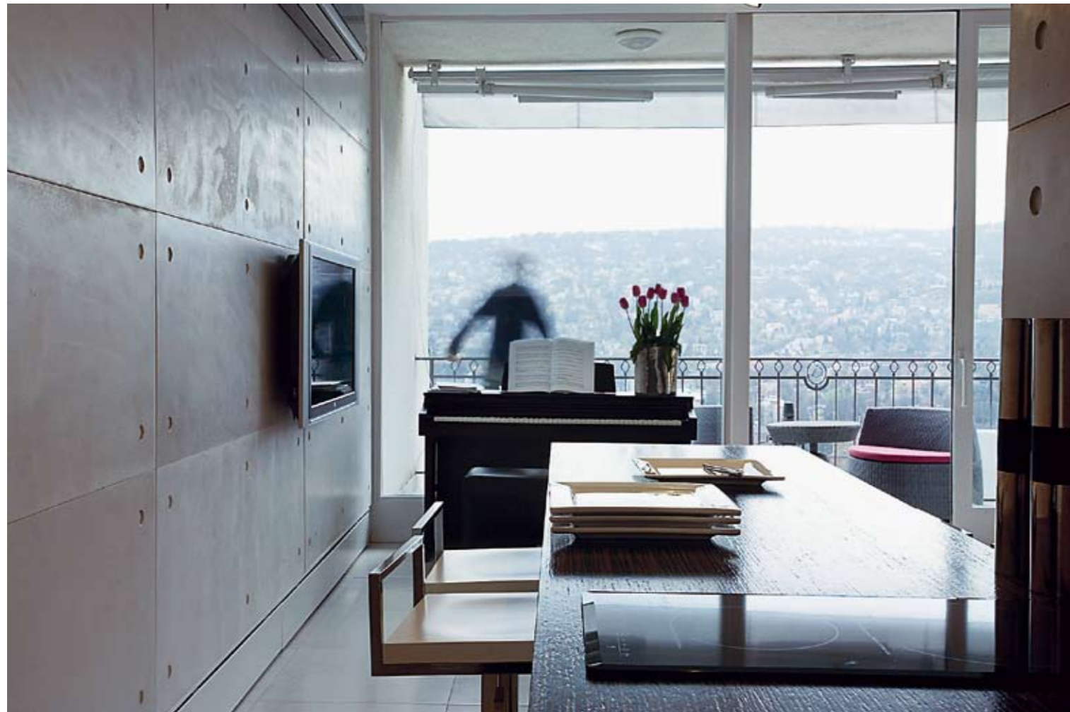
János-hegyi panoráma. Teraszbútor: Dedon a Brühl and Co üzletből

A megrendelő és a tervező sikeres közös munkájának alapja: kreatívan, merészen, innovatív eszközökkel kifejezni a megbízó elképzeléseit egy modern, kozmopolita otthonról.