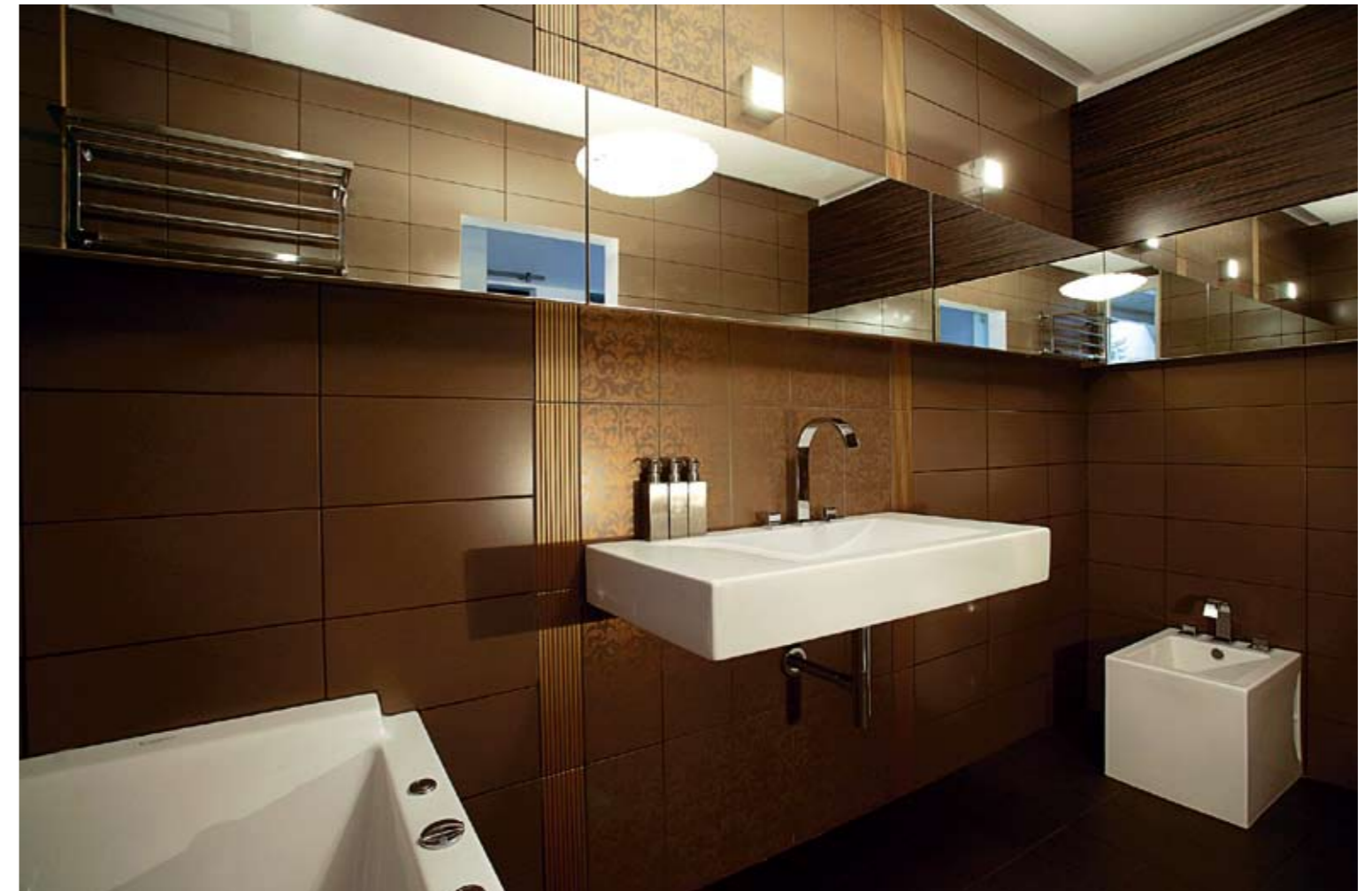
Barokkos fürdőszoba. Saniterek: Simas; csaptelep: Zucchetti; burkolólapok: Cer Viva