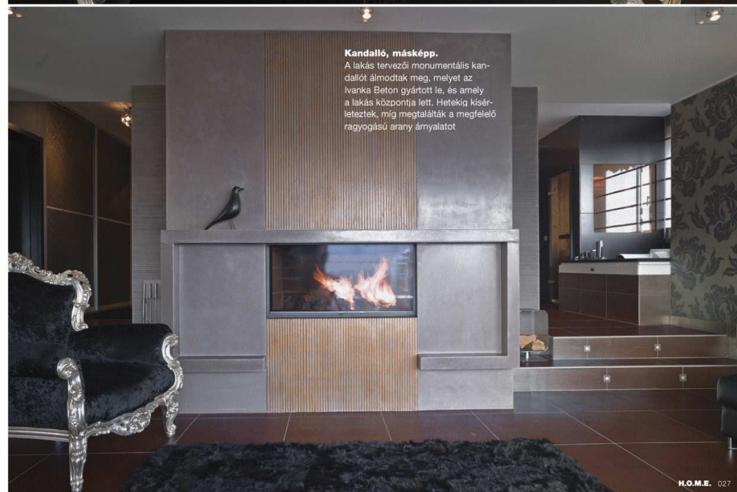
Kandalló, másképp. A lakás tervezői monumentális kan- dallót álmodtak meg, melyet az Ivanka Beton gyártott le, és amely a lakás központja lett. Hetekig kísér- leteztek, míg megtalálták a megfelelő ragyogású arany árnyalatot