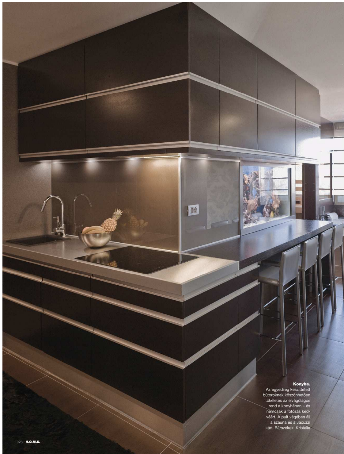
Konyha. Az egyedileg készített bútoroknak köszönhetően tökéletes az elvágólagos rend a konyhában – és nemcsak a fotózás kedvéért. A pult végében áll a szauna és a Jacuzzi kád. Bárszékek: Kristália