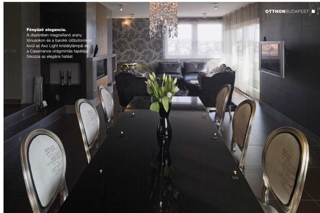
Fényűző elegancia. A diszkréten megcsillanó arany tónusokon és a barokk ülőbutorokon kívül az Axo Light kristálylámpái és a Casamance virágmintás tapétája fokozza az elegáns hatást