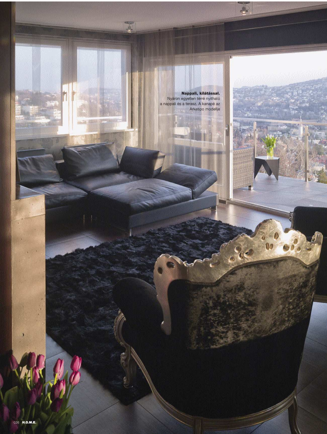
Nappali, kilátással. Nyáron egyetlen térére nyitható a nappali és a terasz. A kanapé az Arketipo modellje